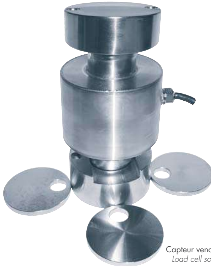
Capteur vendu séparément Load cell sold separately